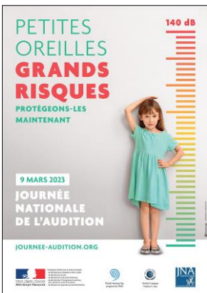
Affiche officielle de la Campagne JNA 2023