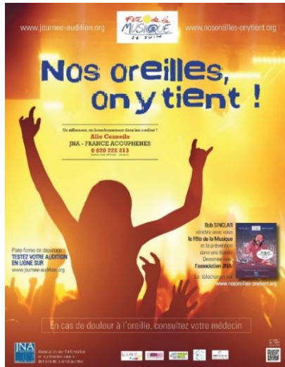
Affiche officielle de l'association JNA pour la fête de la musique